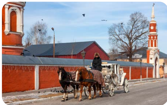
ОДНОДНЕВНЫЕ ТУРЫ (НА БАЗЕ ПРИГОРОДНОГО СООБЩЕНИЯ)