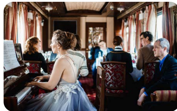
ТЕМАТИЧЕСКИЕ МАРШРУТЫ НА ПАРОВОЗНОЙ ТЯГЕ