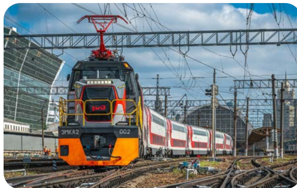
СОВРЕМЕННЫЙ ПОДВИЖНОЙ СОСТАВ