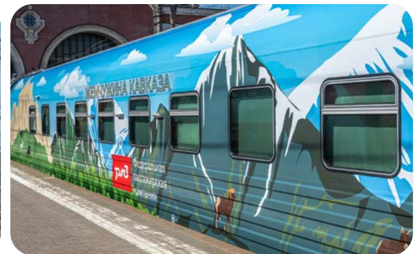
СТИЛИЗОВАННЫЕ (БРЕНДИРОВАННЫЕ) ПОЕЗДА

Как следствие – все больший интерес потребителя к такому виду туризма.