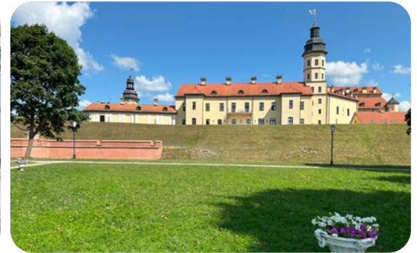
ТУРЫ ВЫХОДНОГО ДНЯ