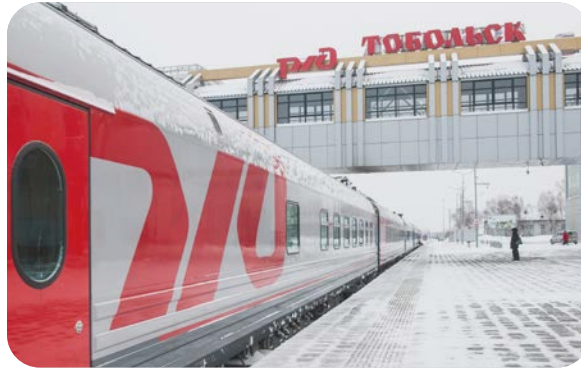
КРУИЗНЫЕ ДЛИННЫЕ МАРШРУТЫ